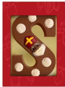
Decolette S | Lait et blanc

Des délicieuses friandises aux surprises gourmandes, nous avons quelque chose pour chaque goût et budget . Restez à l'écoute pour découvrir notre offre complète !