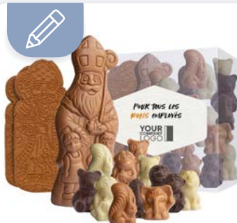
Sharing Coffret Cadeau saint Nicolas