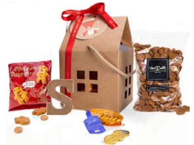
Friandises saint Nicolas | Sachet de bonbons