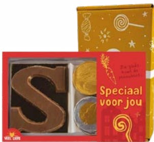
Coffret Duo | Lettre en chocolat & pièces de monnaie