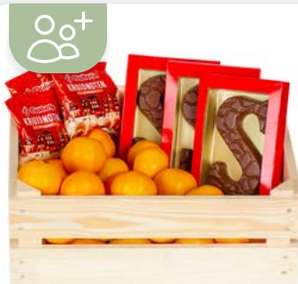
Corbeille de fruits tendances oranges mandarines