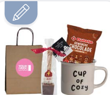
Froid dehors, chaud dedans | Paquet saint Nicolas